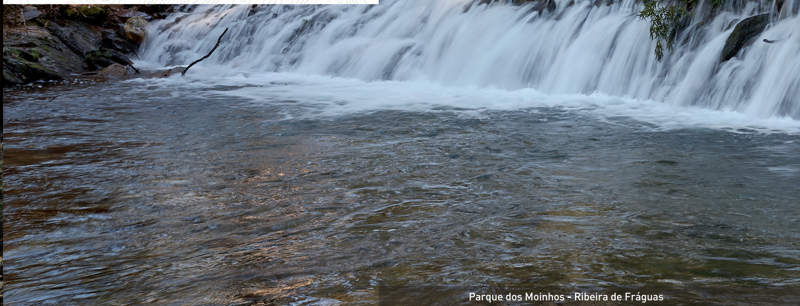
Parque dos Moinhos - Ribeira de Fráguas

Tecelagem, artes decorativas e bordados, trabalhos em madeira, esteiras em palha de bunho, olaria e cestaria.