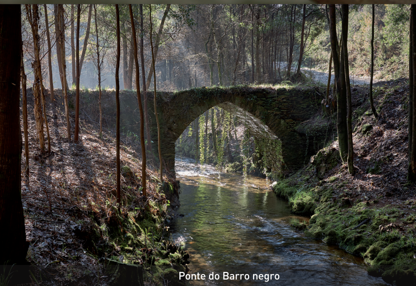
Ponte do Barro negro