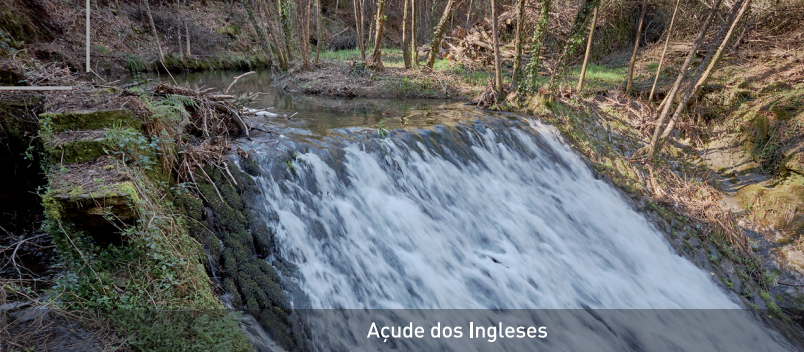
Açude dos Ingleses