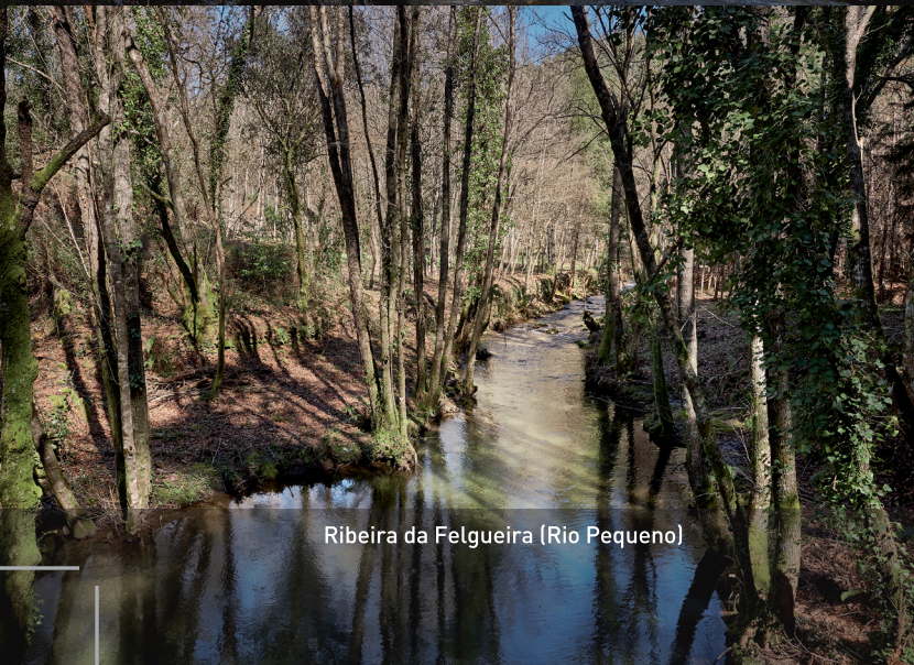
Ribeira da Felgueira (Rio Pequeno)